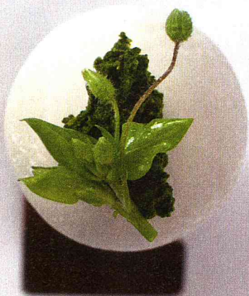
Optisch top: Im »Reinstoff« wird auch Entenleber mit Butterkeks und Rahm gekonnt angerichtet

Das hippe Restaurant in der ehemaligen jüdischen Mädchenschule ist kontrovers, wird international beachtet. Auguststraße 11–13, 10117 Berlin T: +49/(0)30/33 00 60 70, tgl. ab 12 Uhr www.paulysaal.com